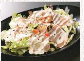
生ハムとスモーク サーモンのサラダ ¥580