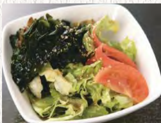
わかめたっぷり 海藻サラダ ¥480