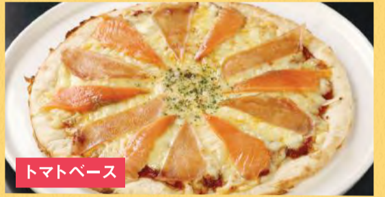
トマトベース 生ハムとスモークサーモンピザ ¥1,500