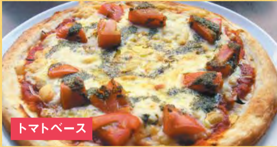
トマトベース トマトとバジルピザ ¥1,500