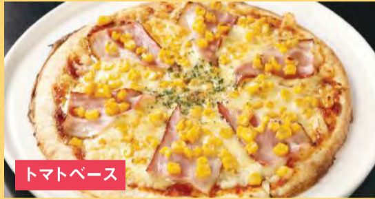
トマトベース ベーコンとコーンピザ ¥1,500