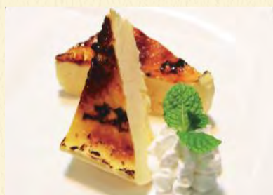
カタラーナ ¥460 上はパリパリ、中はとろけるほどなめらかクリーム!