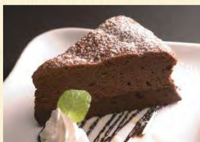
ガトーショコラ ¥460 濃厚なチョコレートが口の中でとろけるう〜!