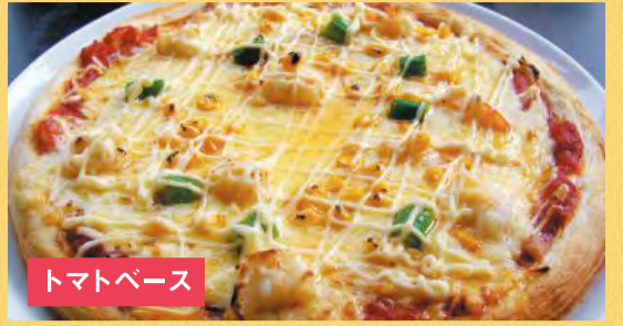
トマトベース えびマヨネーズピザ ¥1,500