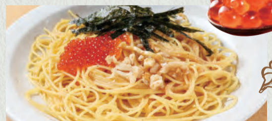
海の幸のご褒美 (いくら・つぶ・たらこ)