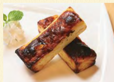
バスクチーズケーキ (ブルーチーズ入り) ¥460 ブルーチーズがたっぷり入った本物志向のチーズケーキ!