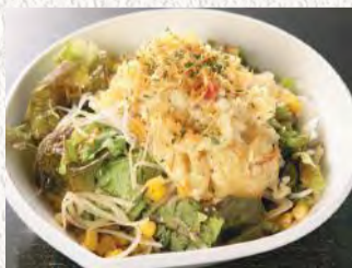
あつあつじゃがの ホクホクサラダ ¥580