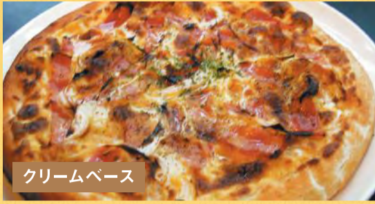
クリームベース カルボナーラピザ ¥1,500