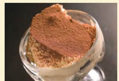
ティラミス ¥460 マスカルポーネチーズを使用したケーキの定番!