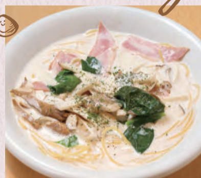
ベーコンと きのこのクリームスープ