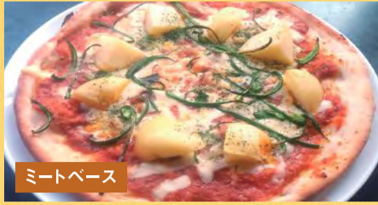
ミートベース じゃがミートピザ ¥1,500