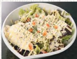
鶏肉スライスの みそマヨサラダ ¥580