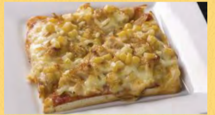
ツナマヨとコーン ¥550