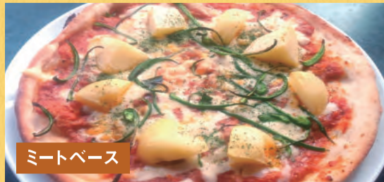
ミートベース じゃがミートピザ ¥1,500