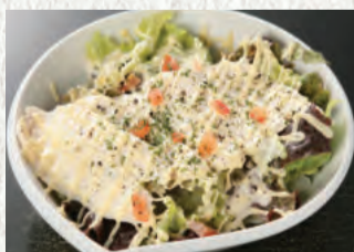
鶏肉スライス みそマヨサラダ