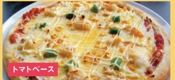
トマトベース えびマヨネーズピザ ¥1,500