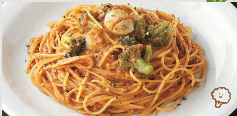
ホタテとブロッコリーの ミートクリーム