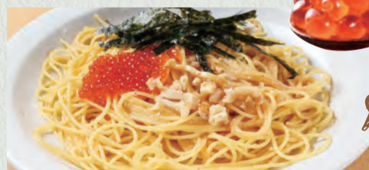
海の幸のご褒美 (いくら・つぶ・たらこ)