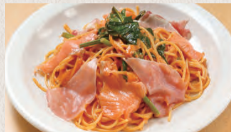
生ハムとスモーク サーモンのトマトクリーム