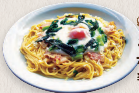
とろろ温泉玉 カルボナーラ ¥1,350