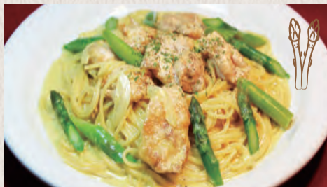
チキンとアスパラの カレークリーム