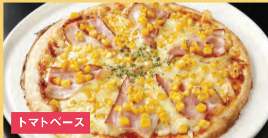
トマトベース ベーコンとコーンピザ ¥1,500