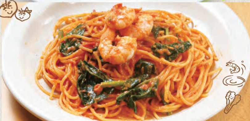
えびとほうれん草の トマトクリーム