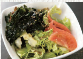
わかめたっぷり 海藻サラダ