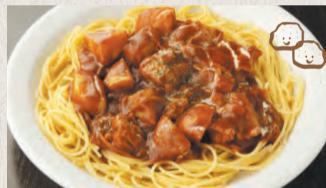
チキンとじゃがいもの デミグラスソース