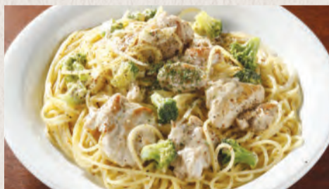
チキンと ブロッコリーのマスタードソース