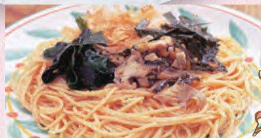
石炭のスパゲティ