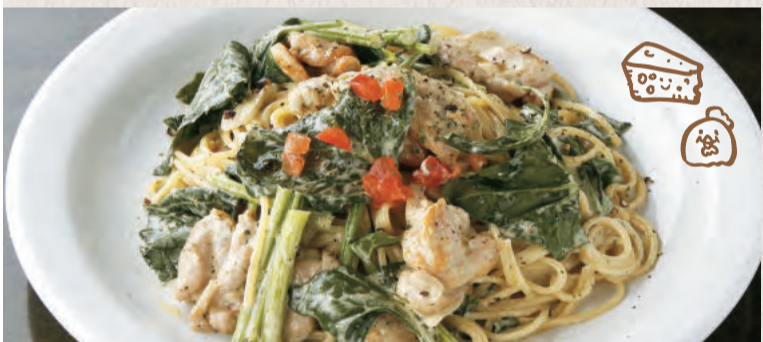
チキンとほうれん草の チーズクリーム