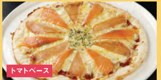
トマトベース 生ハムとスモークサーモンピザ ¥1,500