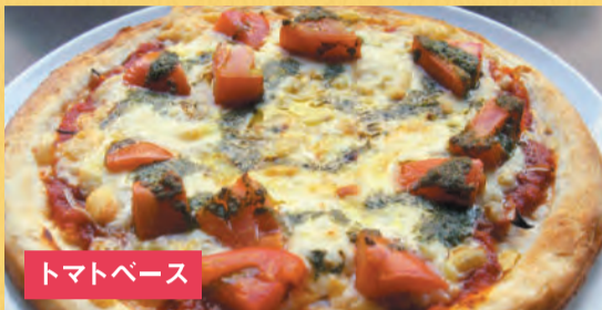
トマトベース トマトとバジルピザ ¥1,500