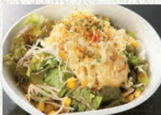
あつあつじゃがの ホクホクサラダ