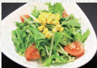
野菜サラダ (レタス・水菜・トマト・コーン)