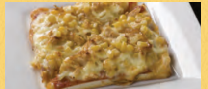
ツナマヨとコーン ¥550