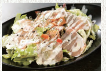
生ハムとスモーク サーモンのサラダ