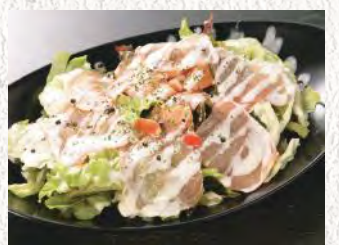
生ハムとスモーク サーモンのサラダ ¥580