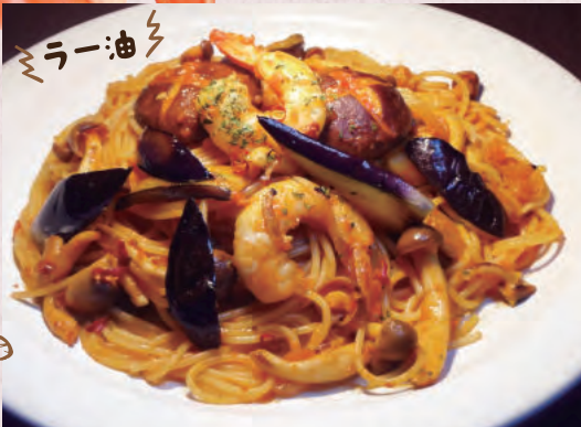
えびときのこの ピリ辛トマトソース