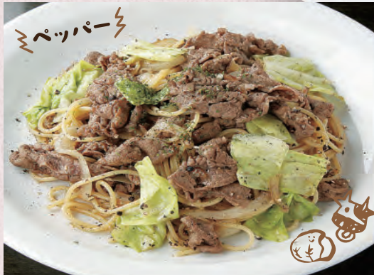
ビーフとキャベツの ペッパーソース