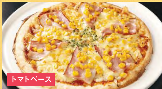
トマトベース ベーコンとコーンピザ ¥1,500