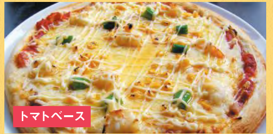
トマトベース えびマヨネーズピザ ¥1,500