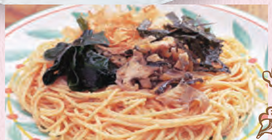
石炭のスパゲティ