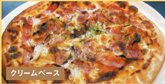
クリームベース カルボナーラピザ ¥1,500