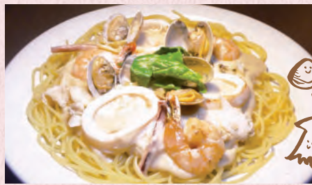
海の幸 クリームソース ¥1,450