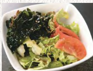
わかめたっぷり 海藻サラダ ¥480