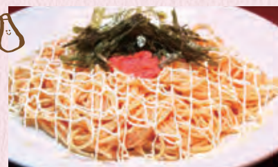
明太子マヨネーズ