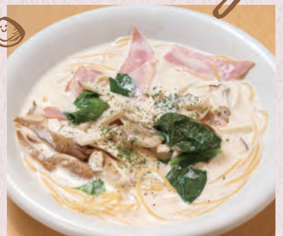
ベーコンと きのこのクリームスープ