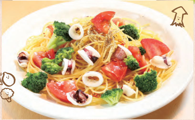
いかとブロッコリーの レモンバター