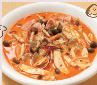
貝あさりと きのこのトマトスープ