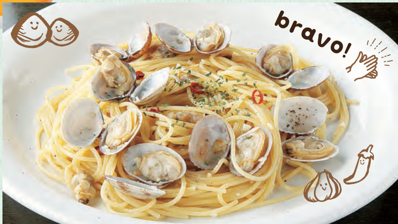
ボンゴレ (塩こしょう味)