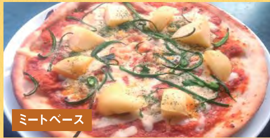
ミートベース じゃがミートピザ ¥1,500