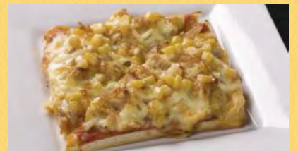
ツナマヨとコーン ¥550