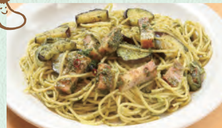
厚切りベーコンと なすのバジルソース