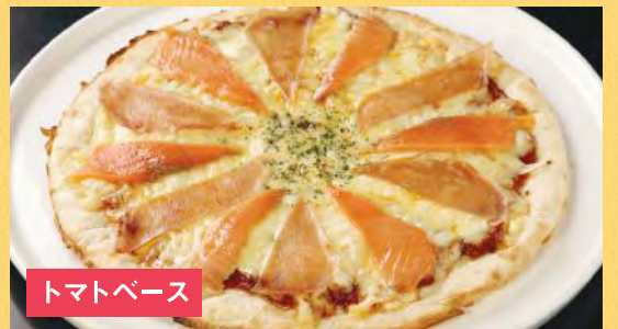
トマトベース 生ハムとスモークサーモンピザ ¥1,500