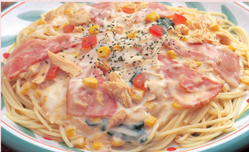
ベーコンとツナのクリームソース ¥1,100

◆チキンのクリームソース ¥950 ◆えびのクリームソース ¥950 ◆ポパイのスパゲティ (ほうれん草とベーコンの玉子クリーム風) ¥1,100