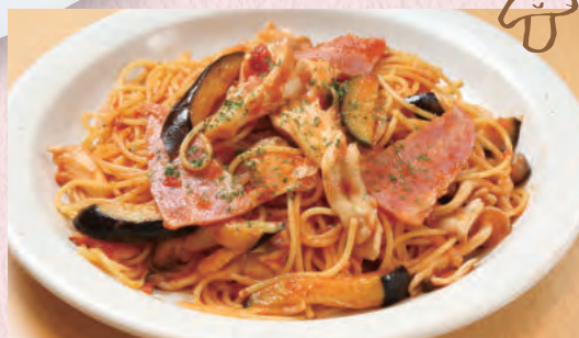
ベーコンときのこの トマトソース ¥1,100