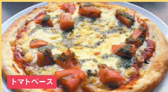
トマトベース トマトとバジルピザ ¥1,500