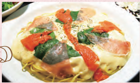
生ハムとスモーク サーモンのクリームソース ¥1,300