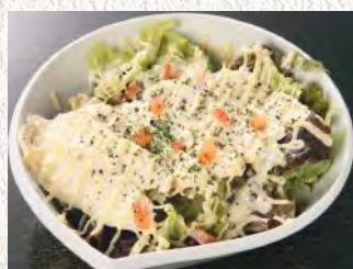
鶏肉スライスの みそマヨサラダ ¥580