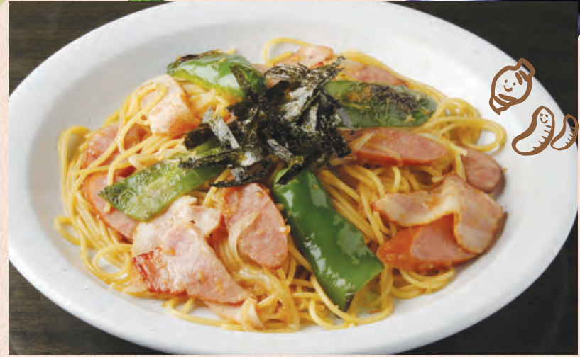
ベーコンとフランクの ジンジャーソース