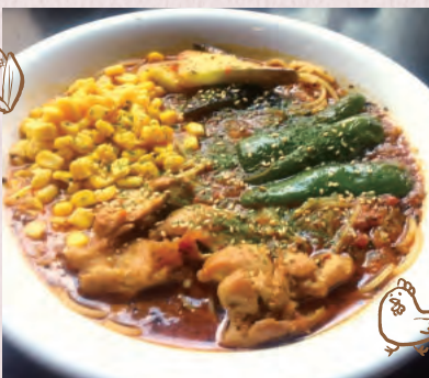
チキンの スープカレー