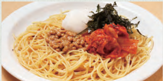
大根おろしと納豆・キムチ ¥850