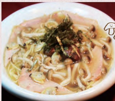
ベーコン・ あさり・きのこスープ