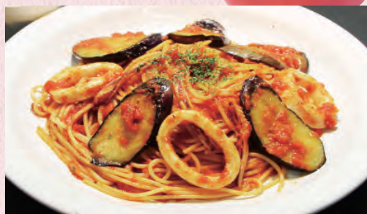
なすといかの トマトソース ¥1,100

◆チキンのトマトソース ¥950 ◆えびのトマトソース ¥950 ◆ピザ屋トマトソース ¥1,300