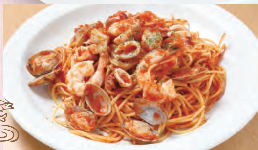
海の幸トマトソース ¥1,450 (ベスカトーレ)