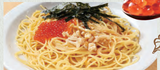
海の幸のご褒美 (いくら・つぶ・たらこ)