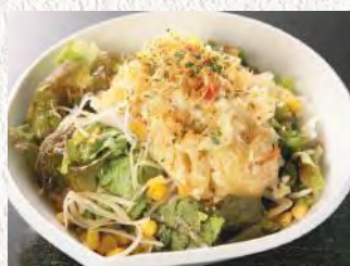
あつあつじゃがの ホリホリサラダ ¥580