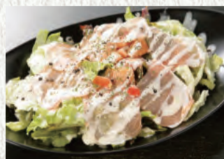
生ハムとスモーク サーモンのサラダ