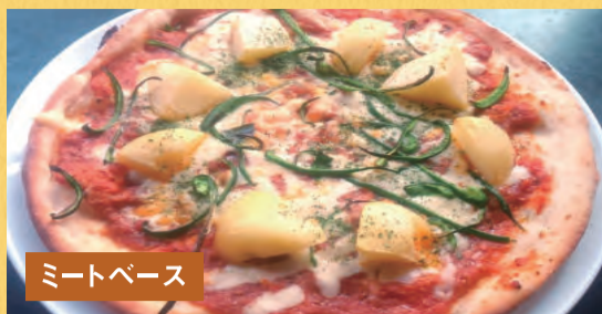
ミートベース じゃがミートピザ ¥1,500