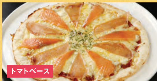
トマトベース 生ハムとスモークサーモンピザ ¥1,500