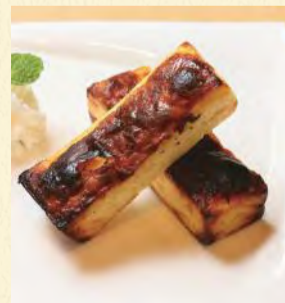
バスクチーズケーキ (ブルーチーズ入り) ¥460