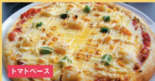
トマトベース えびマヨネーズピザ ¥1,500