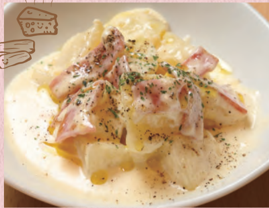
じゃがいもとベーコンのチーズクリーム ¥480