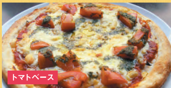
トマトベース トマトとバジルピザ ¥1,500