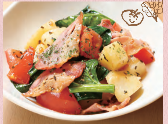
じゃがいもとベーコン・ほうれん草のトマトバジル ¥580