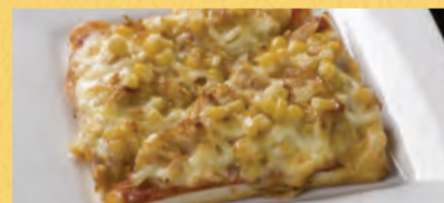
ツナマヨとコーン ¥550