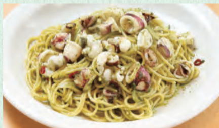
タコとイカのバジルソース