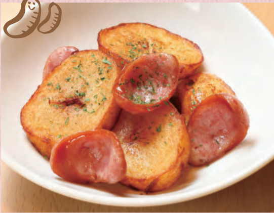
じゃがいもとソーセージの塩・コショウ味 ¥480