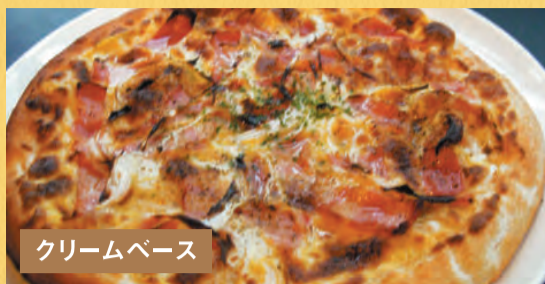
クリームベース カルボナーラピザ ¥1,500